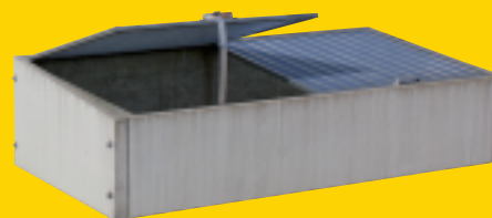
Größe Frühbeet: 200 x 100 x 50 cm