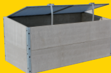
Größe Hochbeet: 200 x 100 x 90 cm

Die Abdeckung besteht aus wärmedämmenden Doppelsteg-elementen, dadurch wird das frühe Wachstum der Pflanzen gefördert.